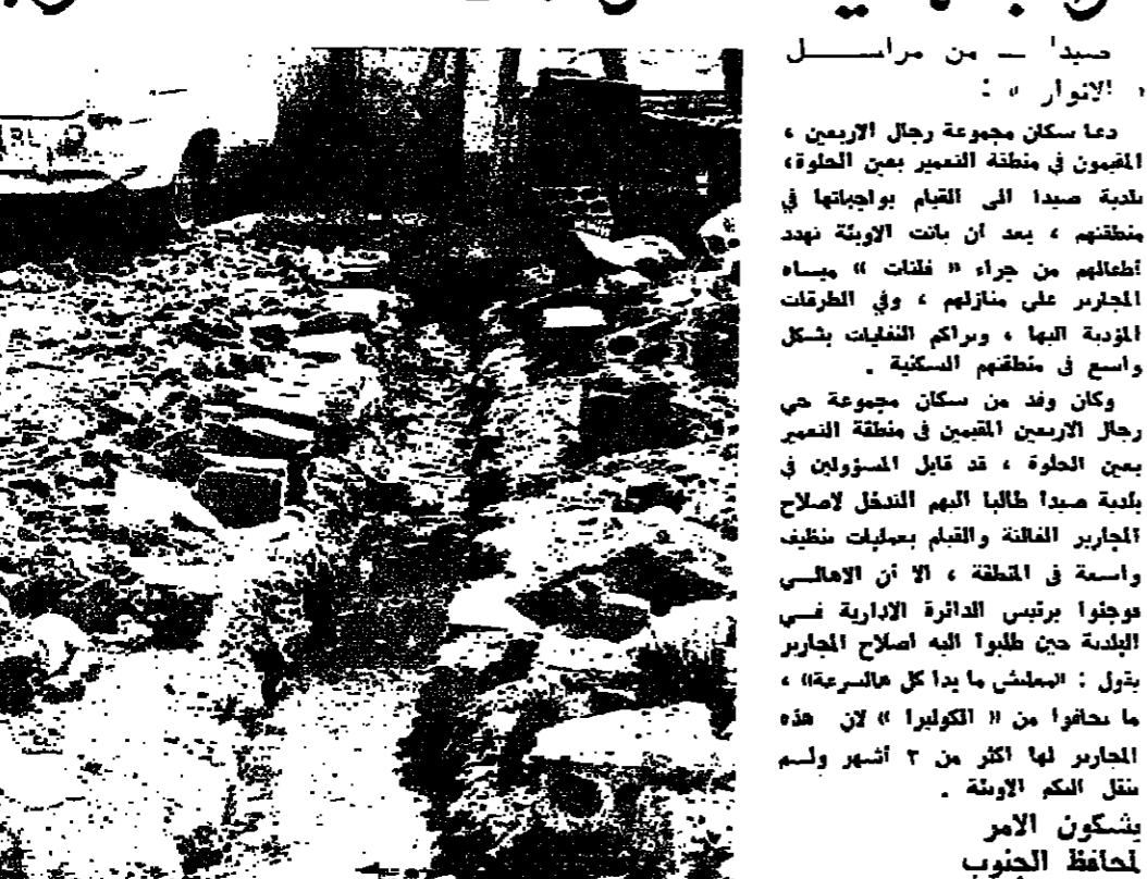
أحد المجاري المكشوفة في منطقة الممر

دعا سكان مجموعة رجال الارمين ، المقيمون في منطقة التعمير بين الحارة ، بلدية صيدا الى القيام بواجبها في منطقتهم . بعد ان باتت الابوة تهدد اطفالهم من جراء «نفات» مياه المجاري على منازلهم ، وفي الطرقات المزدجة بها ، وبرامك التفليات بشكل واسع في منطقتهم السكنية . وكان وفد من سكان مجموعة حي رجال الارمين المقيمين في منطقة التعمير بين الحارة ، قد قابل المسؤولين في بلدية صيدا طالبا اليهم التدفق لاصلاح المجاري المكشوفة والقمام بعمليات نظيف واسعة في المنطقة ، لان ان الامعالي نوجوا برئيس الدائرة الادارية قسري البلدية حين طلبوا اليه اصلاح المجاري بشرف : الممشى ما يدا كل حالسرة» ، ما حثوا من «الكوليرا» لان هذه المجاري لها اكثر من ٣ اشهر ولم تنقل الكم الابوة . يشكون الامر لحافظ الجنوب وعننا خرج الوفد مهيدا بللاجوه الى البلدية اذا لم نعالج البلدية نورا الى القمام بواجبها ، تسر الاهالي ان يقوموا بمناقشة جمعية للحفاظ على شرفها واصحها للصحة . ونشئ منطقة التعمير في من الحارة منذ مدة طويلة ، وسط وحول مياه المجاري والحنها الكريمة ، واكسوام